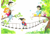
Incontri di formazione del progetto Famiglie al centro: la forza delle reti

Progetto realizzato con il contributo economico dell'Assessorato ai Servizi Sociali della Regione Veneto e del Comune di Torreglia con i comuni del distretto n.4 Ulss 16.